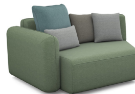
T01L (155 cm x 90 cm x 124 cm)