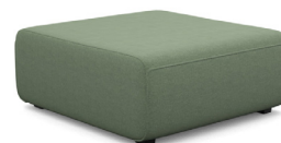
P000 (92 cm x 44 cm x 103 cm)