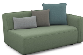
B200R (155 cm x 90 cm x 103 cm)