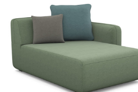
CH00R (110 cm x 90 cm x 160 cm)