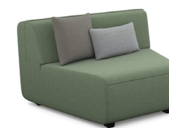
EK01 (124 cm x 90 cm x 103 cm)