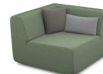
EK00 (103 cm x 90 cm x 103 cm)