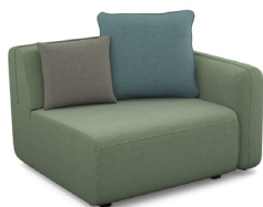
B100R (110 cm x 90 cm x 103 cm)