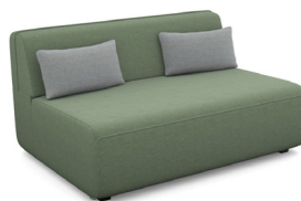
E200 (135 cm x 90 cm x 103 cm)