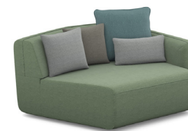
T01R (155 cm x 90 cm x 124 cm)