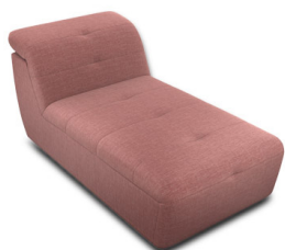
CH00 (82 cm x 74 cm x 165 cm)