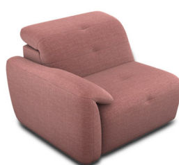
B100EL (98 cm x 74 cm x 99 cm)