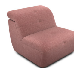
E100 (82 cm x 74 cm x 99 cm)