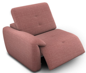
B100EL (98 cm x 74 cm x 99 cm)