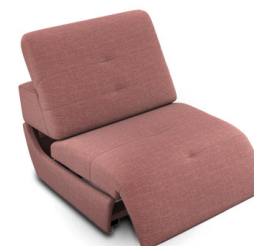
E100EL (82 cm x 74 cm x 99 cm)