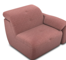
B100ER (98 cm x 74 cm x 99 cm)