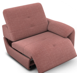
B100ER (98 cm x 74 cm x 99 cm)