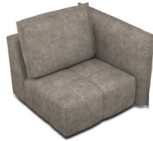
B100R (111 cm x 96 cm x 121 cm)