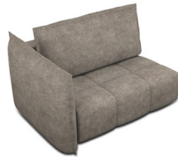
B150L (154 cm x 96 cm x 121 cm)