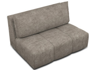
E150 (132cm x 85cm x 105cm)