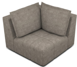
EK00 (105 cm x 90 cm x 105 cm)