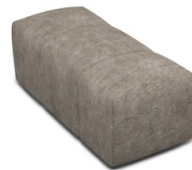
P010 (44 cm x 42 cm x 105 cm)