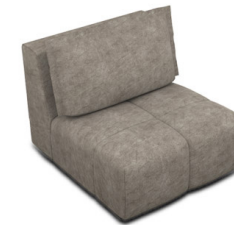
E100 (88 cm x 85 cm x 105 cm)