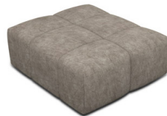
P000 (88 cm x 42 cm x 105 cm)