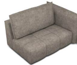
B150R (154 cm x 96 cm x 121 cm)