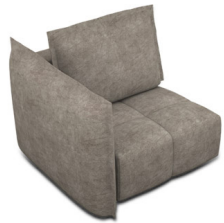
B100L (111 cm x 96 cm x 121 cm)